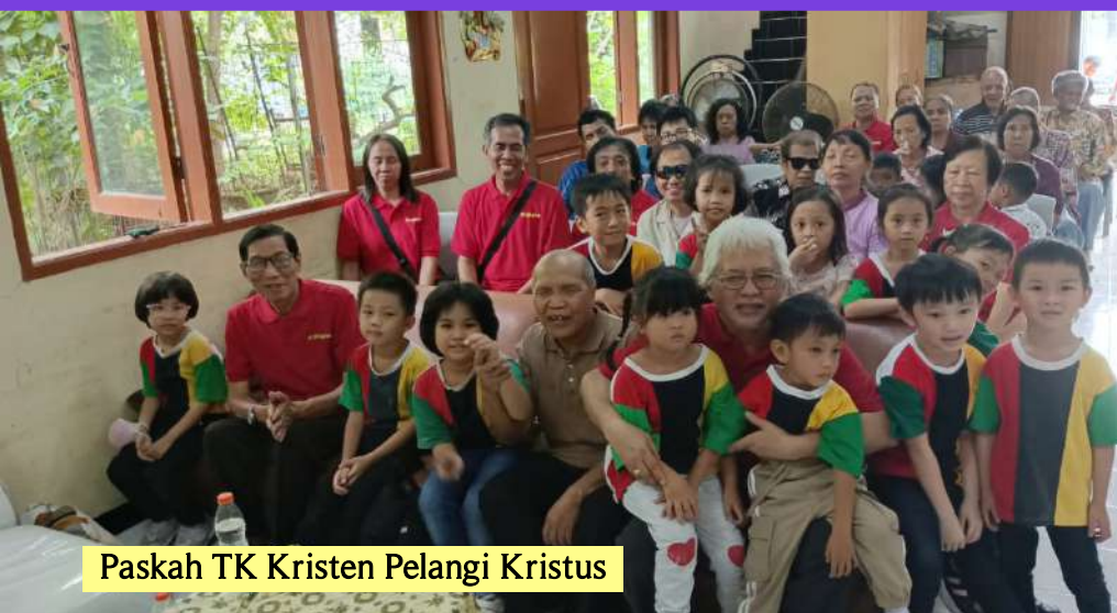
Paskah TK Kristen Pelangi Kristus