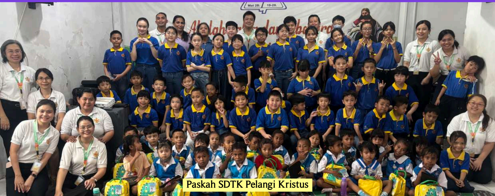
Paskah SDTK Pelangi Kristus