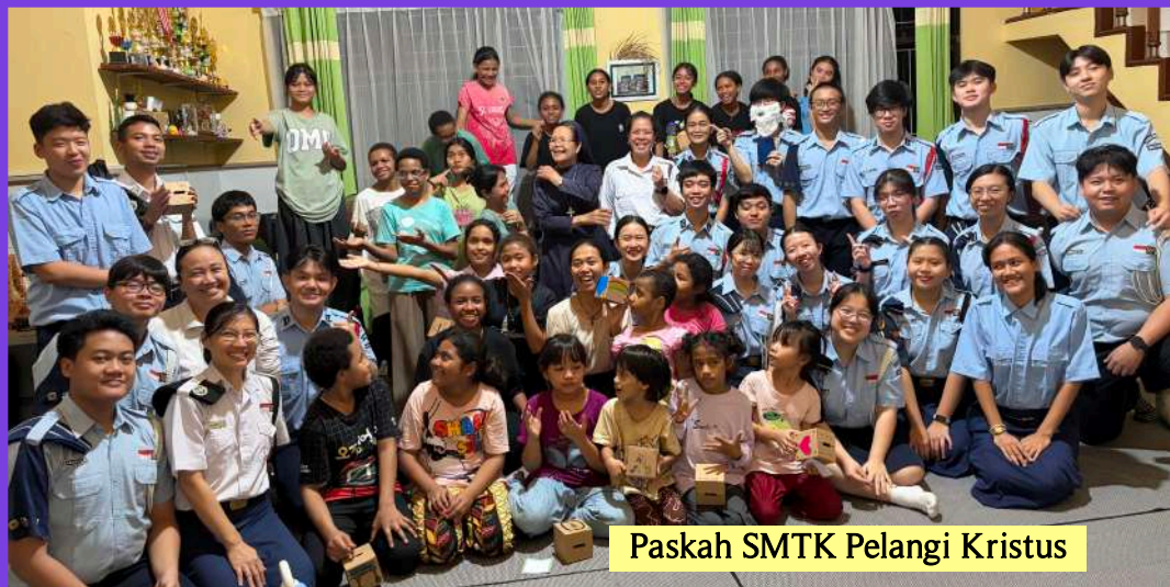
Paskah SMTK Pelangi Kristus